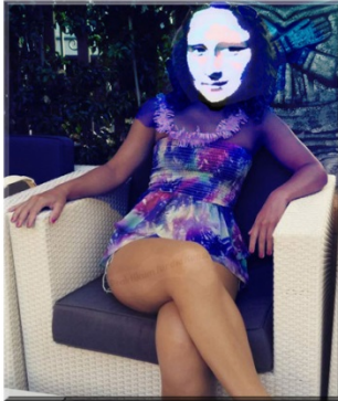
Monalisa lernt Esperanto für EUROPA